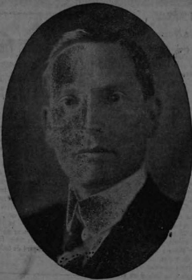
Lic. don ARTURO VOLIO

Los Dips. Comunistas llenaron sus papeletas, poniendo para cada uno de los cargos sus respectivos nombres. — El Rep. don Asdrúbal Villalobos solicitó autorización para explicar detalladamente, en la sesión del jueves próximo el asunto de ventas de giros de diputados